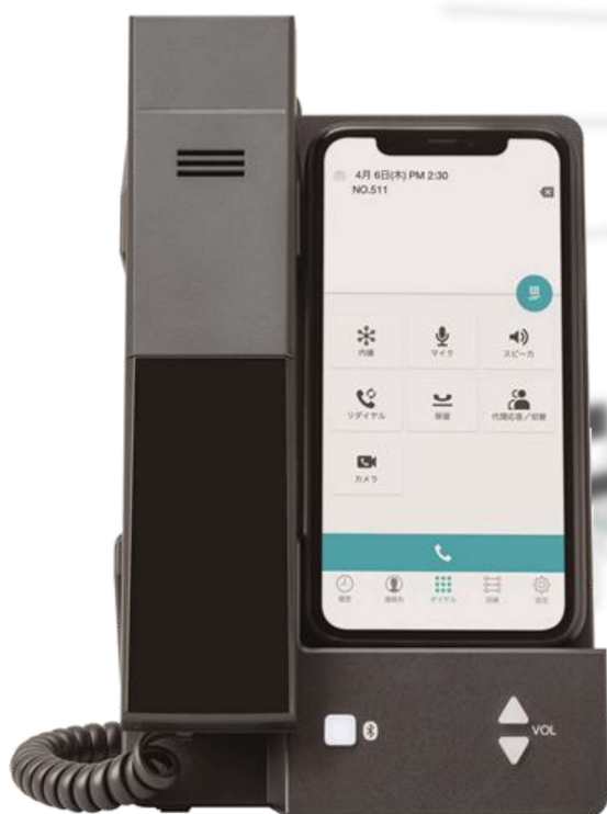
ハンドセット付クレードル (スマートフォンを置いた状態)