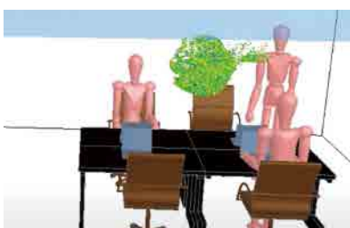
会話などによりエアロゾルが発生