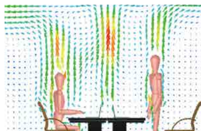
室内の温度差により空気が上昇